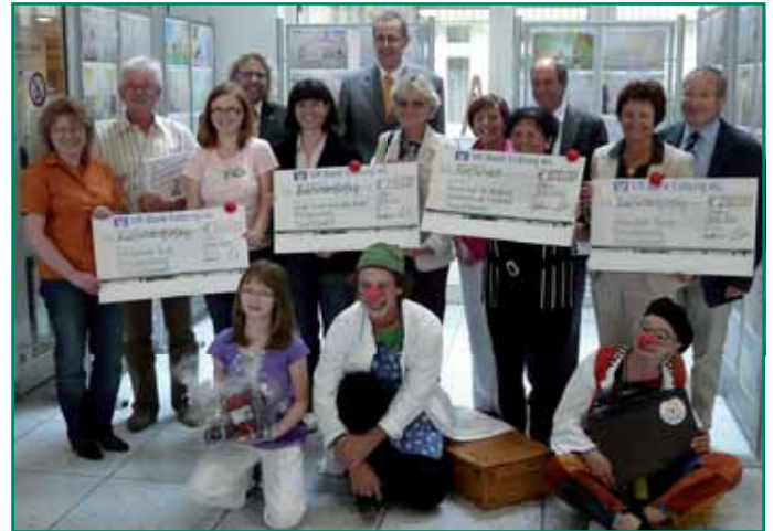
Landrätin und Vorstand der VR-Bank Coburg mit Preisträgern

Außer in Deutschland lief „jugend creativ“ auch in Frankreich, Finnland, Luxemburg, Österreich, Italien und in der Schweiz. Nicht umsonst ist der Wettbewerb der größte seiner Art weltweit und steht seit 1993 unangefochten im