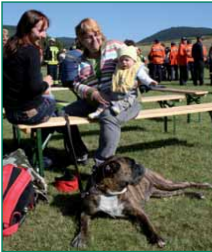
Gar manche kamen mit der ganzen Familie

Nur eine Woche nach dem Kreisfeuerwehrtag fand zudem der 15. Kreisjugendfeuerwehrtag 2009 statt.