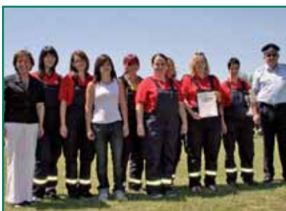
Platz 3 für die Frauen der FFW Rabenäuf.