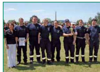
Platz 3 für die Männer der FFW Spechtsbr.