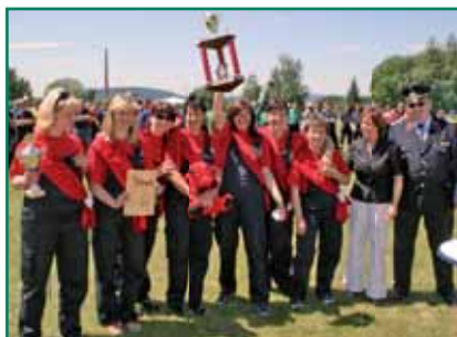
Platz 1 für die Frauen der FFW Goldisthal