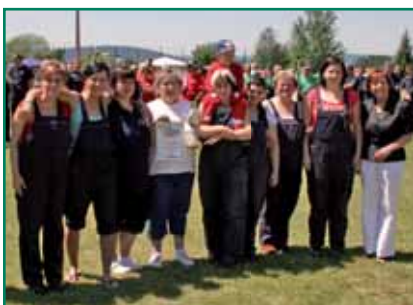
Platz 2 für die Frauen der FFW Meng-Häm.