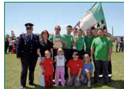
Platz 1 für die Männer der FFW Oberlind