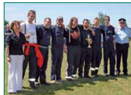
Platz 2 für die Männer der FFW Köppelsd.