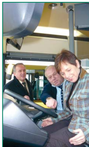
Die Landrätin sitzt Probe

Das Innere der Niederflerbusse wurde nicht nur aus Gründen