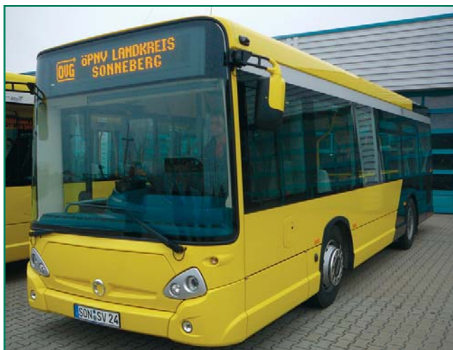
Blickfang: Die neuen Niederflerbusse der OVG

Bei den Neuanschaffungen der OVG handelt es sich um moderne Niederflerstadtbusse vom Typ GX 127 des französischen Busherstellers Heuliez. Die 9,40 m langen Busse verfügen über 19 Sitzplätze und etwa 30 Stehplätze und sind somit ideal für den hiesigen Stadtverkehr geeignet. Die behindertengerecht ausgestatteten Busse sollen speziell auf der Route zwischen Sonneberg und Neustadt bei Coburg eingesetzt werden, die täglich rund 2.100 Fahrgäste nutzen.